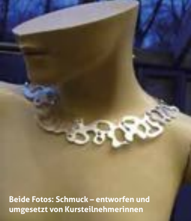
Beide Fotos: Schmuck – entworfen und umgesetzt von Kursteilnehmerinnen

Usch Jacobi Obentrautstraße 46 A 30419 Hannover